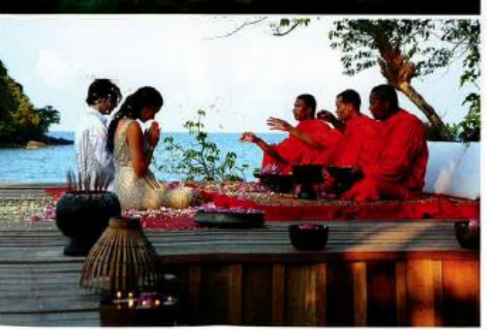
Song Saa Private Island www.songsaa.com