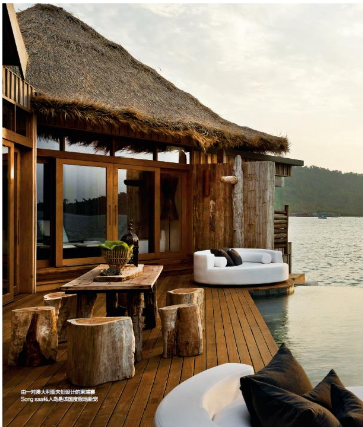
由一对澳大利亚夫妇设计的柬埔寨 Song saaf私人岛是该国度假地新宠