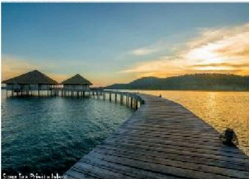
Song Saa Private Island