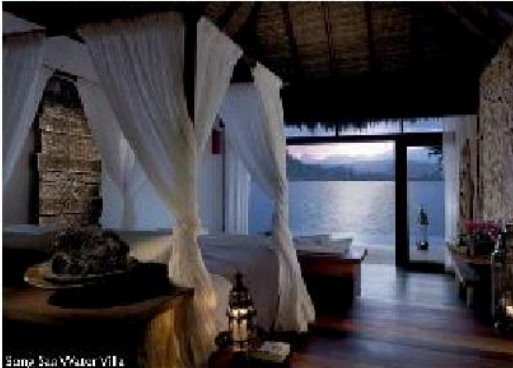
Song Saa Water Villa

Das paradiesische Rückzugsort ist Kambodschas erstes Private Island Resort – ein idealer Ort, um den Alltagsstress hinter sich zu lassen, zu entspannen, sich zu erholen und Weihnachten zu feiern. Die 27 luxuriösen Villen sind aus natürlichen Materialien erbaut, was Teil des nachhaltigen Gesamtkonzeptes des Unternehmens ist. Das Resort arbeitet eng mit der Song Saa Foundation zusammen, um Umwelt, Bevölkerung und Kultur zu schützen. www.songsaa.com