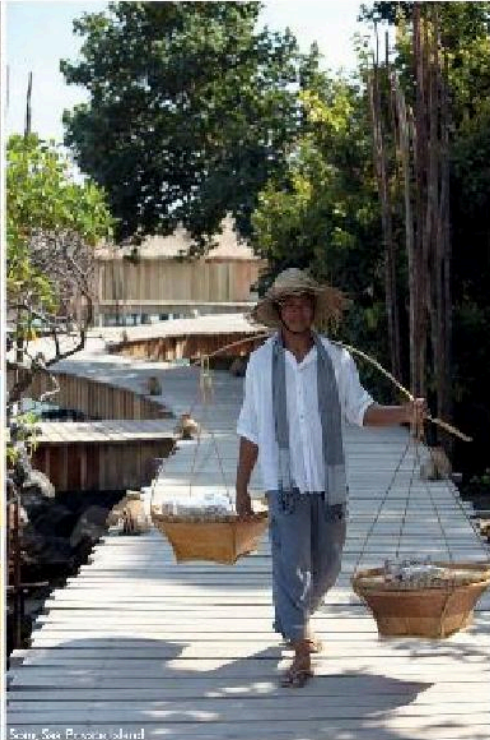
Song Saa Private Island