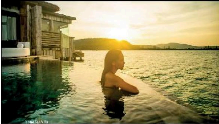
Song Saa Villa