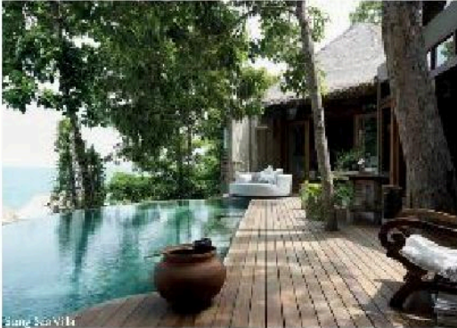
Song Saa Villa

Wer sich in diesem Jahr ein außergewöhnliches Weihnachtserlebnis wünscht, ist auf Song Saa Private Island im Koh Rong Archipel genau richtig. Ob Geschenke von Weihnachtsmännern aus dem Fischerboot, Tanzworkshops mit traditionellen Tänzen aus Kambodscha, Lebkuchen backen mit Blick auf den endlosen Smeleak-Ozean oder lokale asiatische Gourmet-Menüs – über die Feiertage wird das Luxusresort zur einzigartigen Festspielzeit.