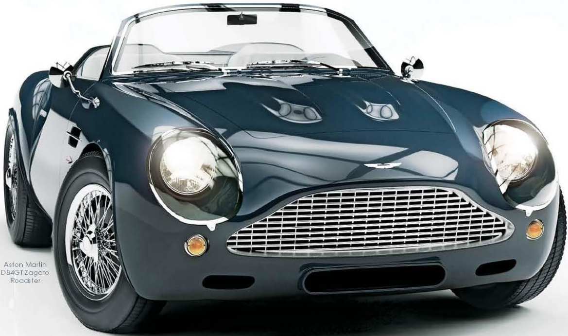
Aston Martin DB4GT Zagato Roadster